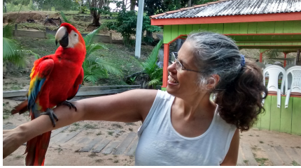
Esta é a arara Ana. Mansa, de subir no braço das pessoas.