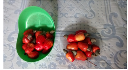
Para finalizar, fizemos a feira e trouxemos, sem custo, esta baciada de caju frescos. Outros dois colegas também trouxeram quantidades desta, o que mostra a fartura.