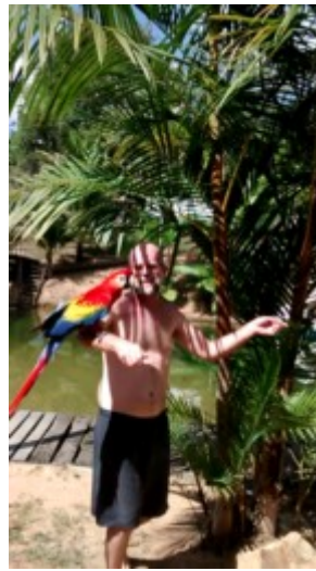
Aqui eu e a bendita, antes da bicada que tomei no dedo. Acho que o álcool tava muito forte e ela ressentiu. ;)