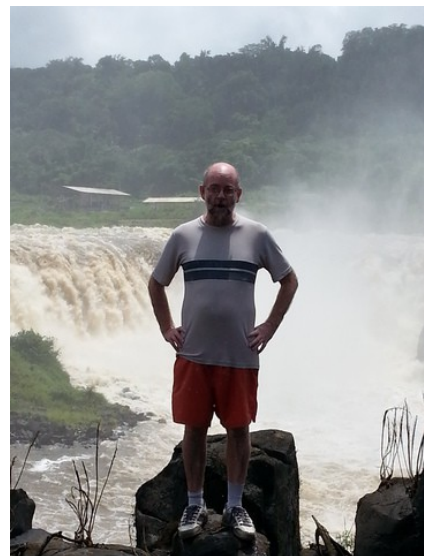
Parte que secou da cachoeira