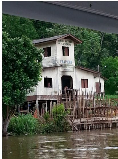
Ponto de coleta da castanha. Coronelismo famoso pela truculência com os extratores.