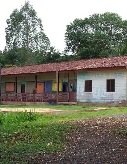
Escola ribeirinha da comunidade Padaria.

Esta semana fizemos um passeio à Cachoeira de Sto Antônio, subindo o Rio Jari. Fica a 25 km daqui e possui uma queda d'água maravilhosa. Estão finalizando a construção da Usina hidrelétrica de Sto Antônio e boa parte da cachoeira se perdeu. Caminhamos sobre as pedras onde já teve muita água. Mesmo assim, ainda é muito bonita. No caminho passamos por uma comunidade ribeirinha, chamada Padaria. Tem uma escola e o regime de aulas é modular. Os professores ficam de dois a três meses e dormem na escola. O dormitório tem várias redes. Coisa impensável ai no Brasil.