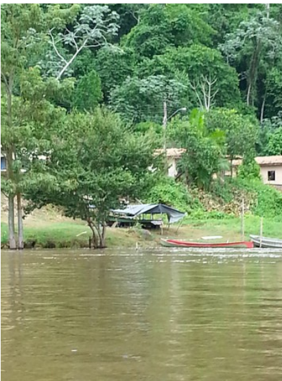
Últimas casas da comunidade e os transportes.