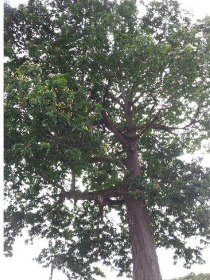
Castanheira. A mais imponente das árvores. Muito grande mesmo!