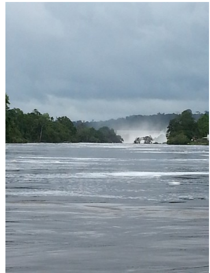
Visão da cachoeira. O Jari aqui é muito largo e começa a ficar mais violento.