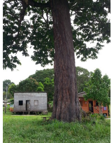
Tronco da castanheira e casas da comunidade ao fundo.